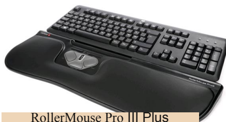
RollerMouse Pro III Plus (clavier non inclus)

La RollerMouse a été spécialement conçue pour maintenir les bras et les épaules dans une position neutre, afin d'améliorer le confort et l'efficacité de l'utilisateur ce qui en fait un produit idéal pour les personnes souffrant d'une perte de mobilité des membres supérieurs.