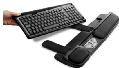
RollerMouse Pro (clavier non inclus)

Stratégiquement placée entre le clavier d'ordinateur et l'utilisateur, la RollerMouse Pro II est parfaitement dans l'axe du clavier, ce dernier venant se placer dans le réceptacle approprié.