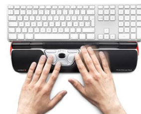
RollerMouse RED (clavier non inclus)

COTICA - 67 rue Saint-Jacques - 75005 PARIS Tél : 01 53 73 12 03 - Fax : 01 78 76 64 01 Email : info@cotica.fr - Web : http://www.cotica.fr