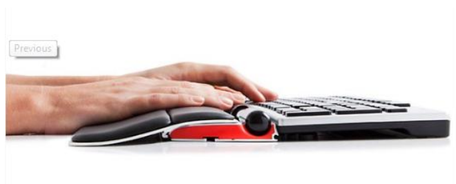
RollerMouse RED PLUS

La RollerMouse Red est aussi disponible en version Red Plus, pour un confort encore plus grand ! La RollerMouse Red Plus bénéficie d'un repose paume plus profond, permettant un support optimal des membres supérieurs et une transition plus douce avec le plan de travail. La RollerMouse Red classique est quant à elle plus adaptée pour des utilisateurs avec des mains plus petites, ou pour des espaces de travail restreints (notamment en profondeur de plan de travail). Grâce à ces deux versions, le confort est maintenant accessible à tous les utilisateurs et tous les espaces de travail !