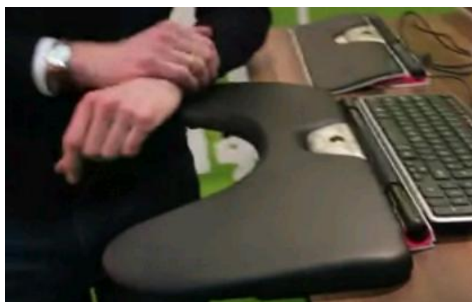
RollerMouse RED avec repose bras large