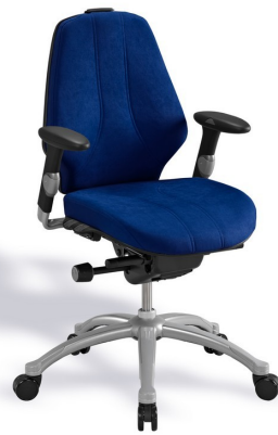
RH Logic 300 - Dossier médium, renfort lombaire et accoudoirs (Appui cervical en option)

2/ Réglages quotidiens : blocage et déblocage en multi positions du mécanisme permettant à l'utilisateur d'effectuer tous les mouvements, avant et arrière, en gardant le dos parfaitement soutenu.