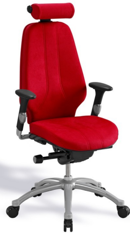
RH Logic 400 - Dossier haut, renfort lombaire, accoudoirs et appui cervical